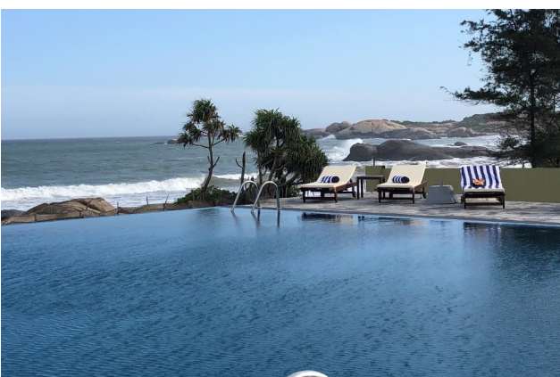
Shuttle zum nahegelegenen Strand mit privatem Pool